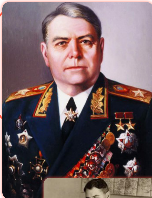
МАРШАЛ ВАСИЛЕВСКИЙ АЛЕКСАНДР МИХАЙЛОВИЧ

дважды кавалер ордена «Победа» и дважды Герой Советского Союза