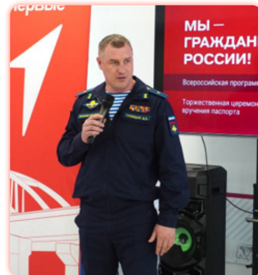
ГРАЖДАНСКАЯ ПОЗИЦИЯ В МИРНОЙ ЖИЗНИ

Председатель Совета регионального отделения Общероссийского общественно- государственного движения детей и молодежи «Движение Первых» Ивановской области